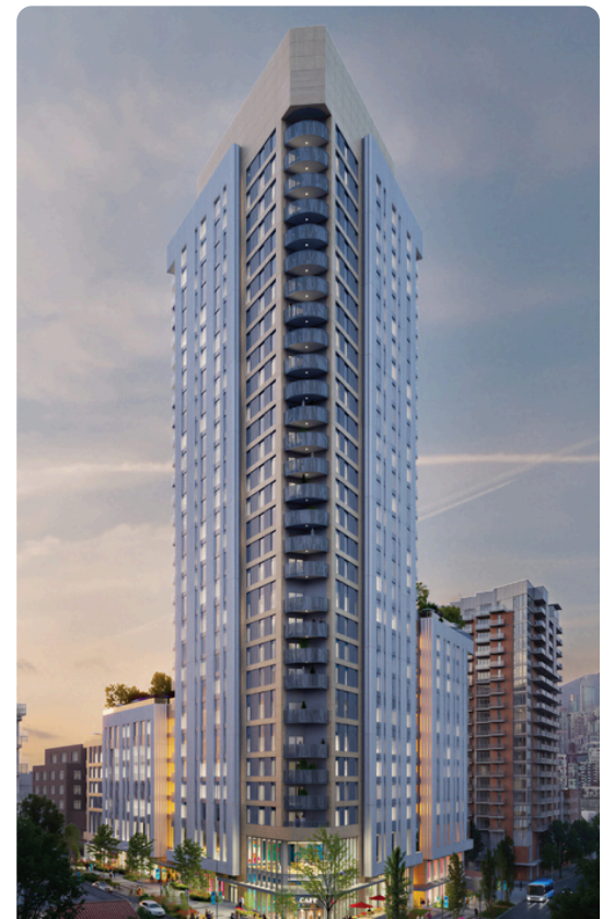
Biswal ng iminungkahing muling pagpapaunlad ng lugar ng Coast Mental Health sa 259-293 East 11th Avenue at 216 Kingsway

Ang proyektong East 11th ay higit pa sa pagpapaunlad ng abot-kayang pabahay. Binabago nito ang punong-tanggapan ng Coast Mental Health tungo sa isang kampus na nakatuon sa komunidad sa Mount Pleasant, na nakabatay sa mahigit 50 taong operasyon at pag-aambag ng Coast sa lokal na komunidad.