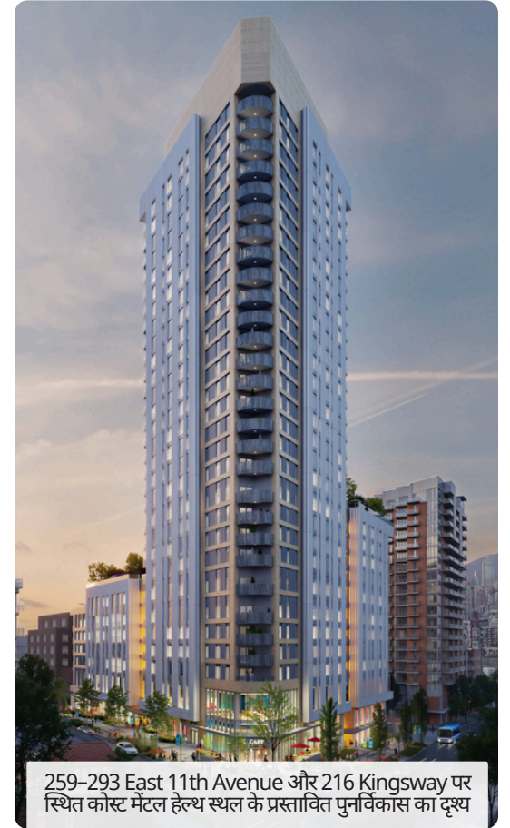
259-293 East 11th Avenue और 216 Kingsway पर स्थित कोस्ट मेंटल हेल्थ स्थल के प्रस्तावित पुनर्विकास का दृश्य

East 11th परियोजना एक किफायती आवास विकास परियोजना से अधिक है। यह कोस्ट मेंटल हेल्थ के मुख्यालय को माउंट प्लेज़ेंट में एक समुदाय-केंद्रित परिसर में परिवर्तित करती है, और स्थानीय समुदाय में कोस्ट द्वारा 50 वर्षों से अधिक समय से किए जा रहे संचालन एवं योगदान पर आधारित है।